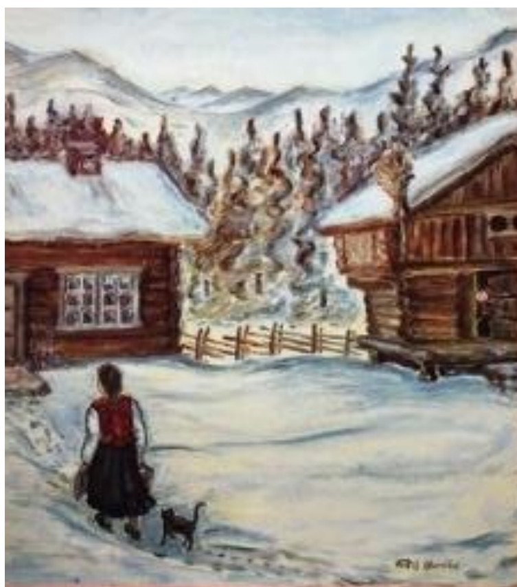
Framsida «Jol i Telemark 1987» teikna av Ruth Nordbø