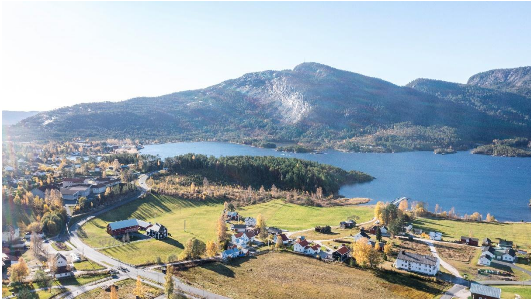
1: Foto frå Kalis foto