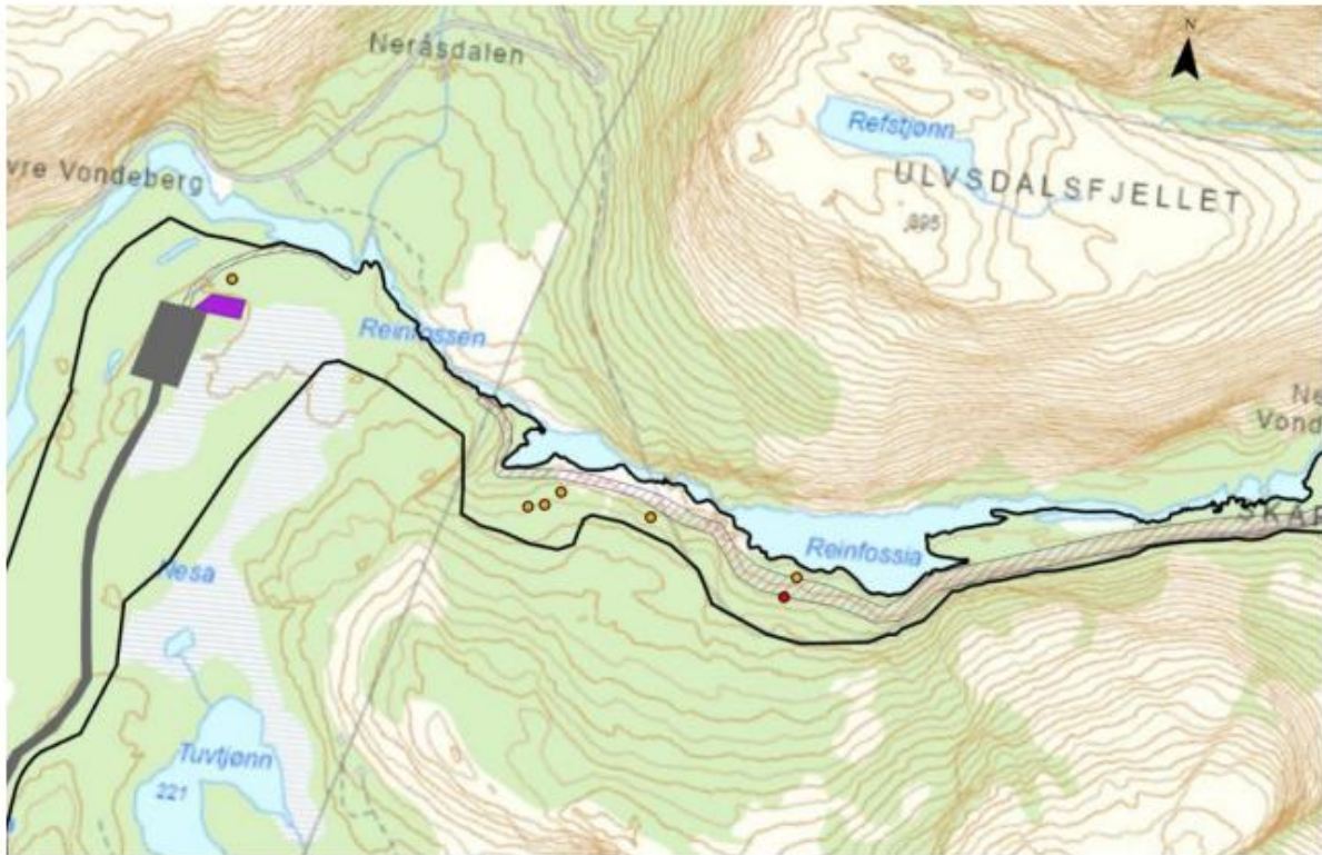
Figur 3.10: Oversikt over kartlagte rødlistede sopper. Furustokkjuke NT i oransje og furuplett NT i rødt.