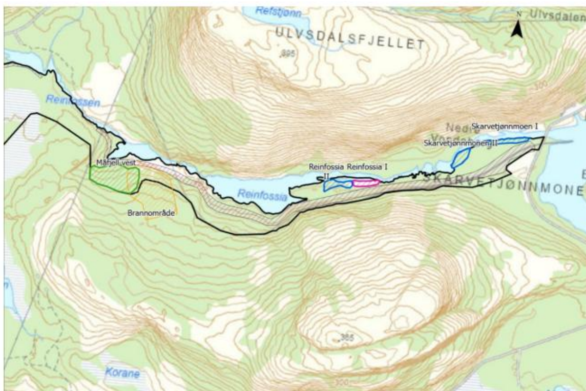
Figur 3.7: Naturtypelokaliteter i tiltaksområdet. Alle lokaliteter er i strekningen mellom Skarvetjønnmoen og Jettegrytene. Kartleggingsområdet i svart. Turveien går øst-vest gjennom kartleggingsområdet.